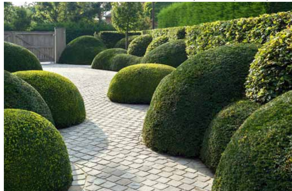
Ob klassisch oder modern, Formschnitte aus Hecken und geometrischen oder organischen Formen verleihen dem grünen Garten das Grundgerüst und bleiben rund ums Jahr präsent.

DESIGN: STIJN CORNILLY