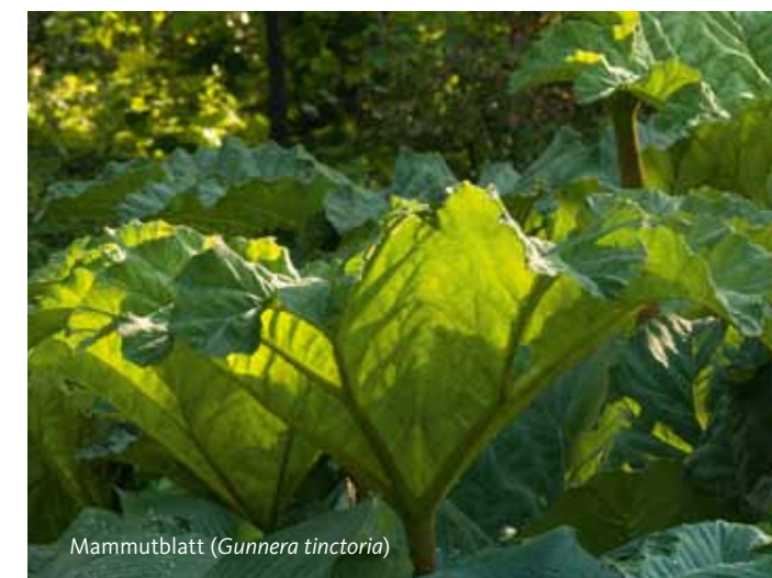
Mammutblatt ( Gunnera tinctoria )