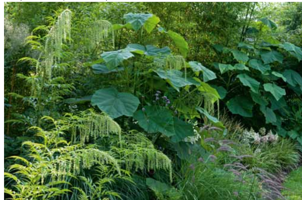
Großartiges Gartenbild mit reduzierter Pflanzenauswahl: immergrüner Bambus, grün blühender Scheinhanf ( Datisca canabina ) und tropisch anmutende Blätter von Paulownia tomentosa .

DESIGN: PETER JANKE