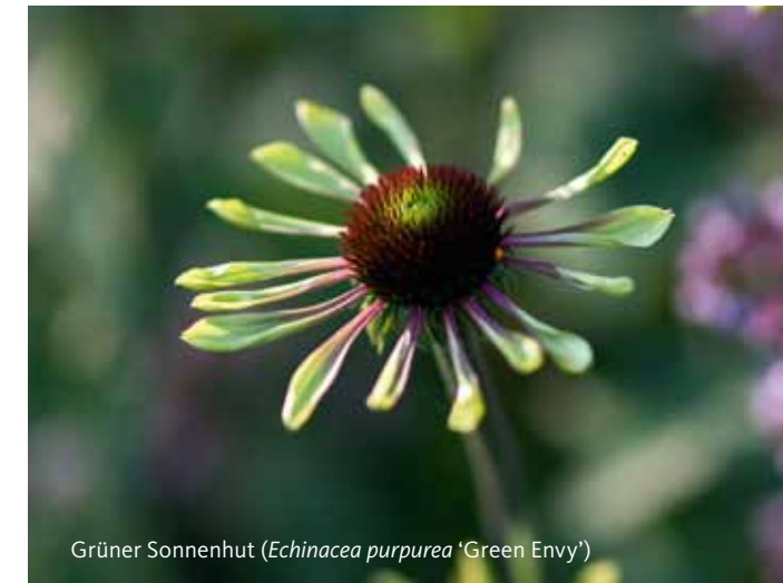
Grüner Sonnenhut ( Echinacea purpurea 'Green Envy')