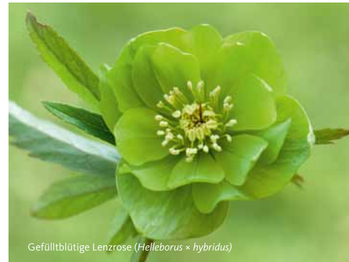
Gefülltblütige Lenzrose ( Helleborus x hybridus )