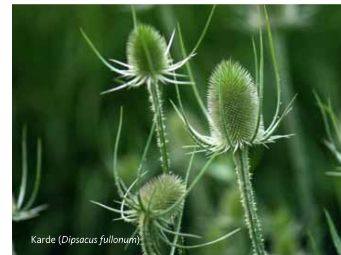
Karde ( Dipsacus fullonum )