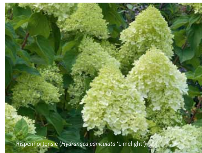
Rispenhortensie ( Hydrangea paniculata 'Limelight')