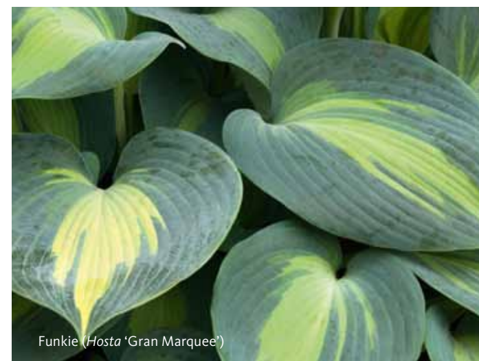
Funkie ( Hosta 'Gran Marquee')