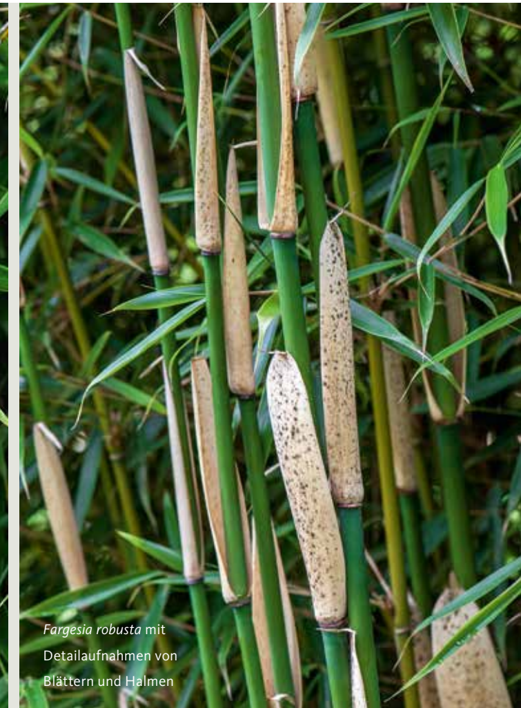
Fargesia robusta mit Detailaufnahmen von Blättern und Halmen