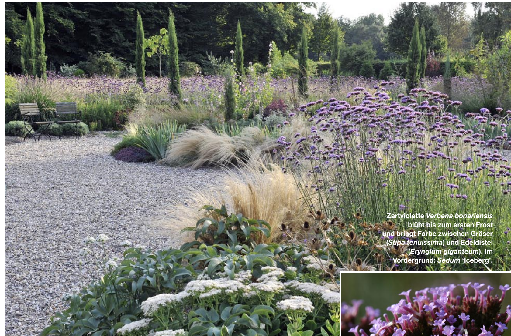
Zartviolette Verbena bonariensis blüht bis zum ersten Frost und bringt Farbe zwischen Gräser ( Stipa tenuissima ) und Edeldistel ( Eryngium giganteum ). Im Vordergrund: Sedum 'Iceberg'.

ohne viel Zutun gedeihen. Denn wenn sich die Pflanzen an einem bestimmten Ort wohlfühlen, bleiben sie gesund. Und sie wachsen schneller, üppiger und schöner als an weniger geeigneten Standorten. Wie schwelgerisch blühend dies selbst an kargen und sonnig-trockenen Standorten gelingen kann, zeigen die Septemberbilder aus meinem Kiesgarten. Denn obwohl hier die Grundbedingungen als gärtnerisch schwierig gelten, kommt mein Garten rund ums Jahr ohne zusätzliche Bewässerung aus. Richtige Pflanze, richtiger Platz: Geeignete Gewächse für einen so extremen Standort gibt es nämlich erstaunlich viele. Und je nachdem, wie sie zusammengefügt werden, welches Bild man aus ihren Farben, Formen und Blattstrukturen zusammensetzt, kann der Ausdruck einer solchen Pflanzengemeinschaft klar und präriehaft oder klassisch-opulent daherkommen. ▶