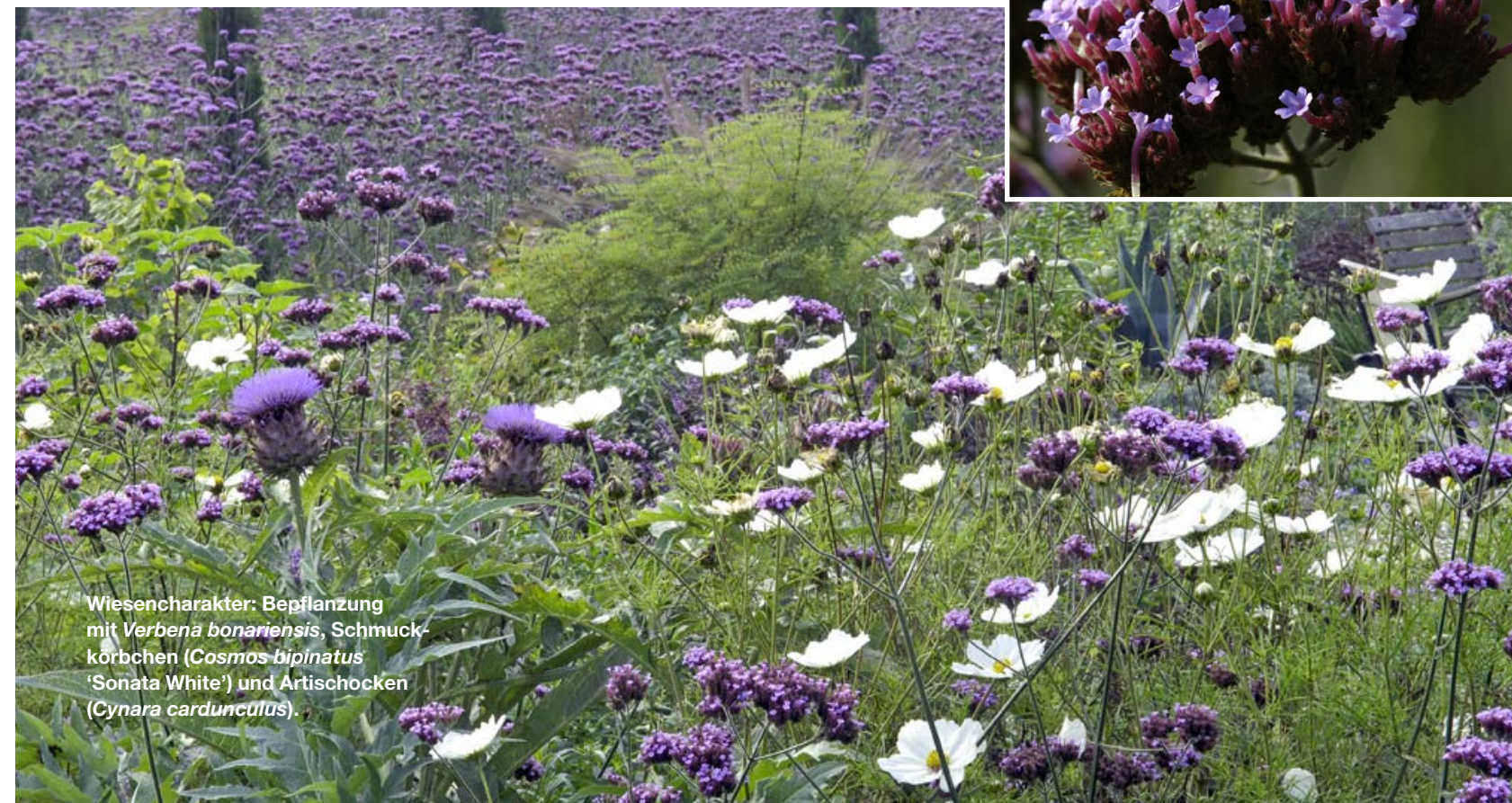
Wiesencharakter: Bepflanzung mit Verbena bonariensis , Schmuckkörbchen ( Cosmos bipinatus 'Sonata White') und Artischocken ( Cynara cardunculus ).