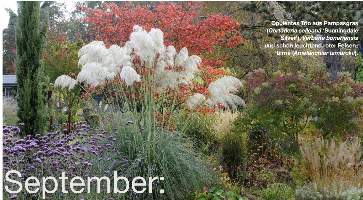
Opulentes Trio aus Pampasgras ( Cortaderia selloana 'Sunningdale Silver'), Verbena bonariensis und schon leuchtend roter Felsenbirne ( Amelanchier lamarckii ).

Er ist ein Pflanzenflüsterer, der neue Star der deutschen Gartenszene. Wie kein anderer verbindet Peter Janke Design und Ökologie. Der Gartengestalter und Staudengärtner nimmt Sie mit auf einen lehrreichen Streifzug durch seinen Garten. Erleben Sie faszinierende Blüten und Pflanzen, die sich wirklich lohnen!