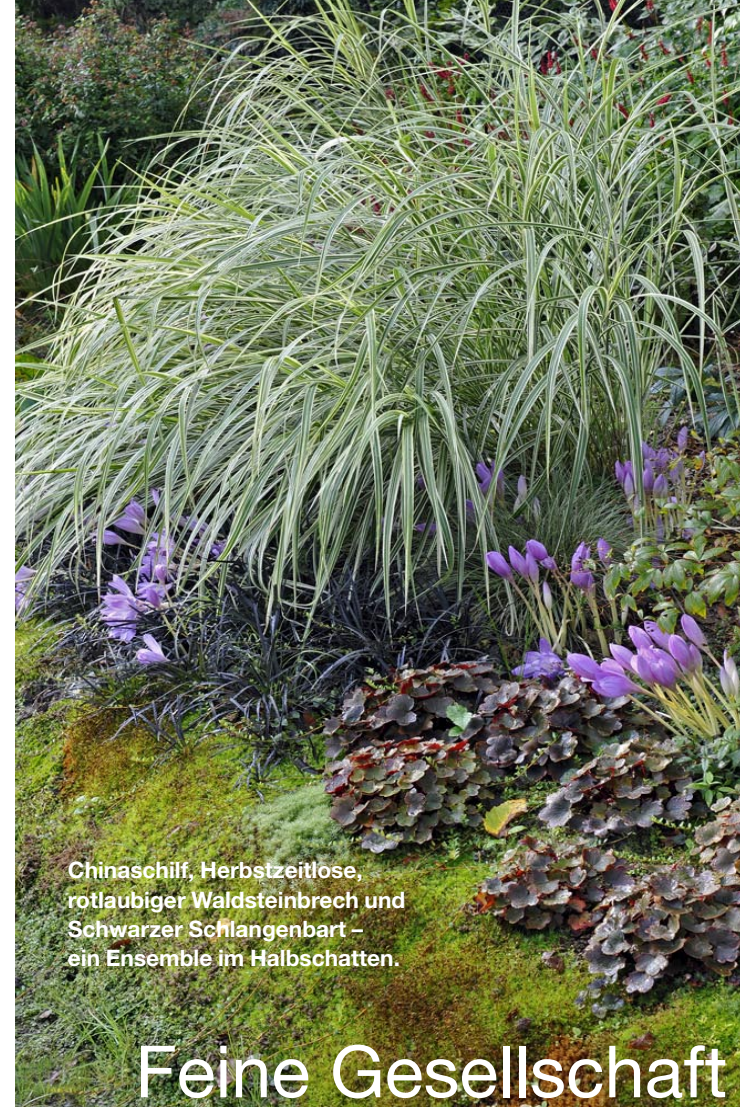
Chinaschilf, Herbstzeitlose, rotlaubiger Waldsteinbrech und Schwarzer Schlangenbart – ein Ensemble im Halbschatten.